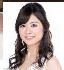
ヴァイオリニスト