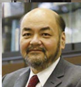
同志社大学大学院教授