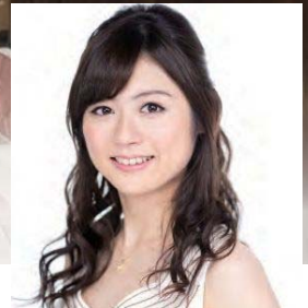
ヴァイオリニスト