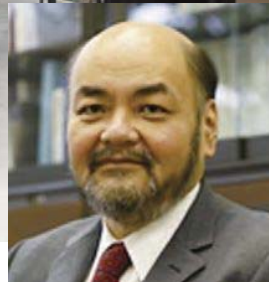
同志社大学大学院教授