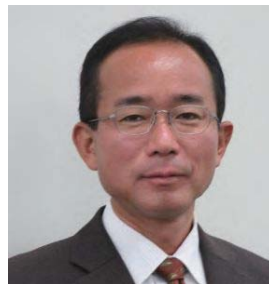
PHP総研地域経営研究センター長