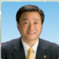
高松市長 大西 秀人