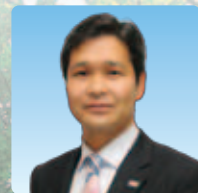
熊本市長 幸山 政史