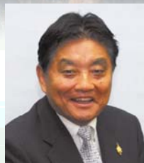
名古屋市長 河村 たかし