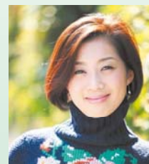
タレント 大東 めぐみ