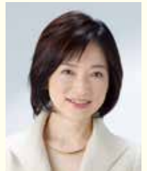
司会進行 フリーキャスター 橋谷 能理子氏