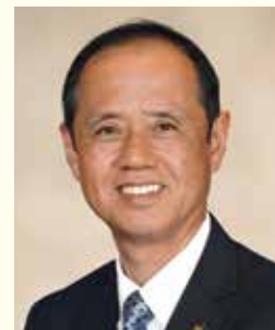
大森 雅夫 岡山市長

※出演者・講演内容は事情により変更になる場合がございます。あらかじめご了承ください。