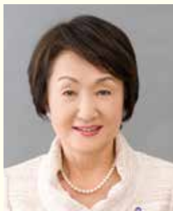
林 文子 指定都市市長会会長/横浜市長