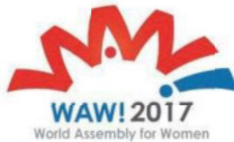
女性が輝く社会に向けた国際シンポジウム (平成29年11月)