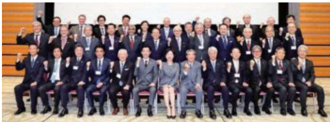
賛同者ミーティングの様子 (平成30年3月)

年に1回、賛同者が集まり、好事例の共有や意見交換を行っています。 また、毎年、賛同者の取組内容をまとめた「女性の活躍推進報告書」を作成しています。