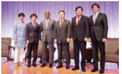
在日米商工会議(ACCJ)主催の Women in Business Summit(平成27年6月)

国際会議やシンポジウム、各種広報誌等において、賛同者の想いや所属組織における取組を紹介し、女性活躍の重要性を発信しています。