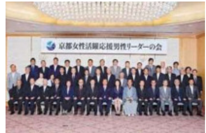
経済団体等と行政(京都市・京都市・京都労働局)の連携によって、京都企業の経営トップ等有志により「京都女性活躍応援男性リーダーの会」を結成。