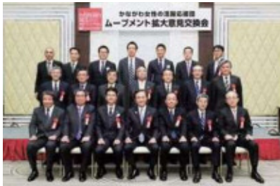
女性の活躍を推進する社会的ムーブメント拡大のため、神奈川県にゆかりの深い企業の男性トップと知事により「かながわ女性の活躍応援団」を結成。

賛同者の働きかけにより、地域において男性リーダーがネットワークを形成し、一丸となって地元の女性活躍推進に積極的に取り組んでいます。