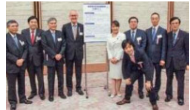
首相官邸における行動宣言公表の様子(平成26年6月)