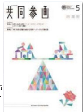
「共同参画」 内閣府男女共同参画局が毎月発行している広報誌で、賛同者の取組を紹介しています。