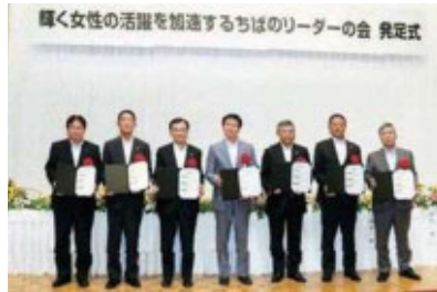
千葉県内の産・官・学のリーダーが連携し、地方創生にもつなげることを目的として「輝く女性の活躍を加速するちばのリーダーの会」を結成。