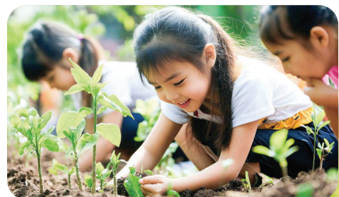
生物多様性に支えられる 「農」と「食」の近さを満喫