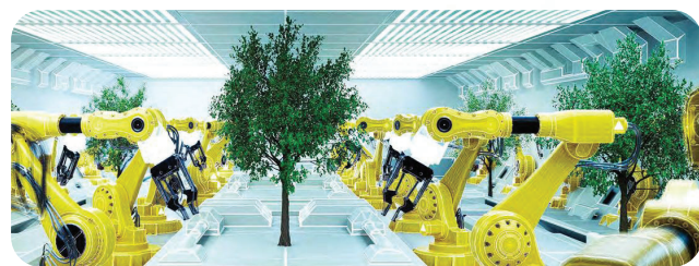
持続可能なグリーン社会を実現する最新のテクノロジー