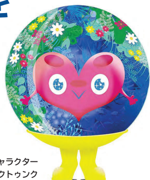
公式マスコットキャラクター トウントウ