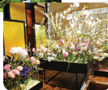
日本の伝統美の生け花や盆栽を 全身で感じる