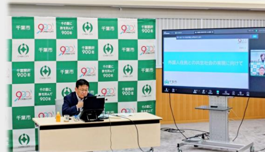
「意見交換会の様子」