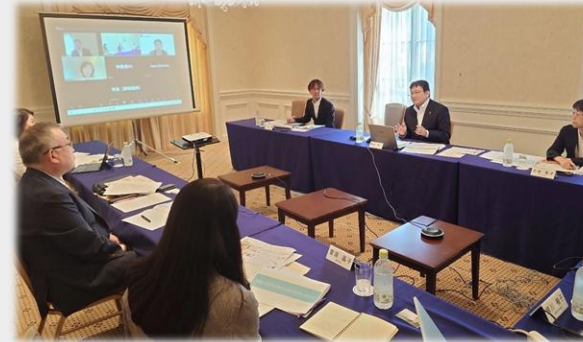
「意見交換会の様子」