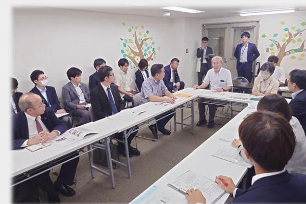
【NPO法人多文化フリースクールちば】