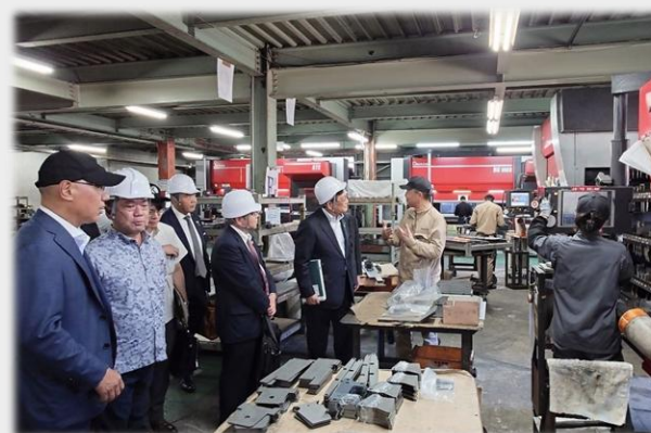
【東原産業株式会社】