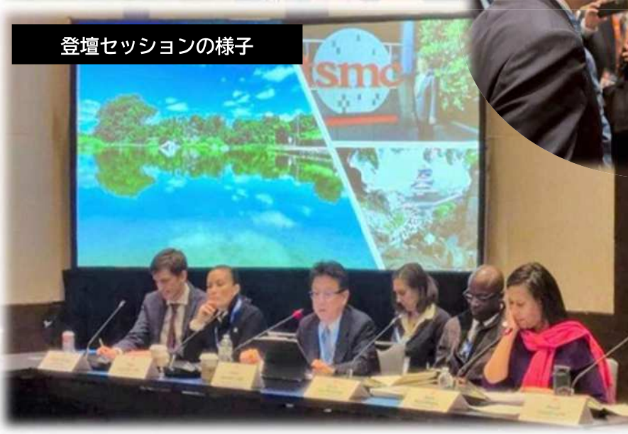
登壇セッションの様子