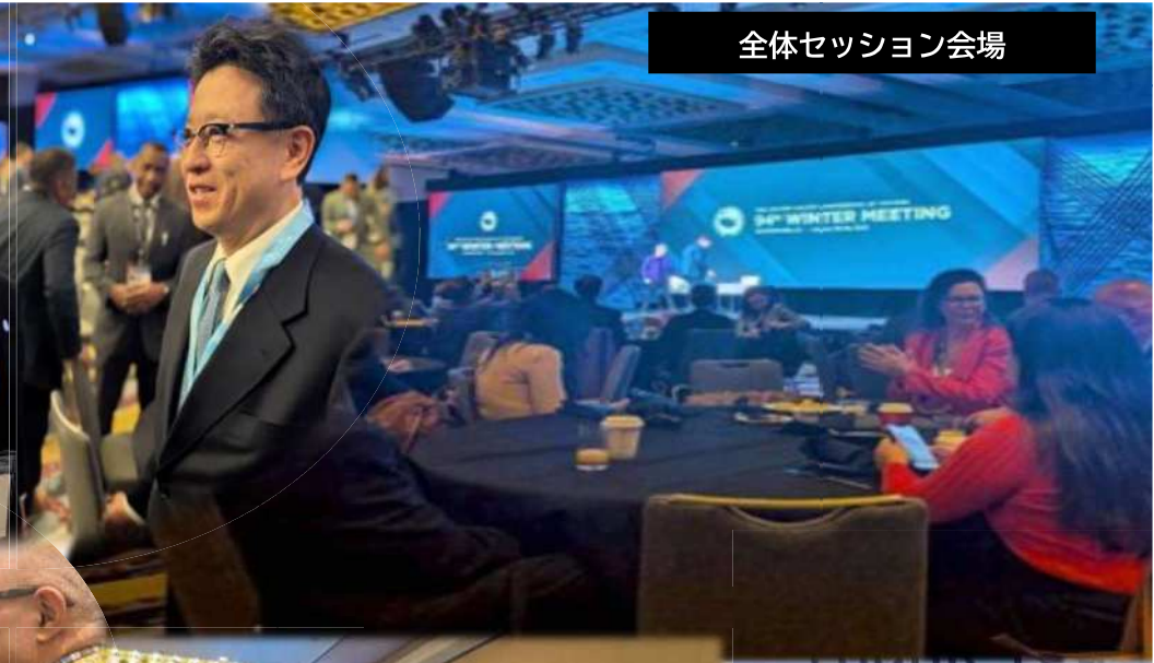
全体セッション会場