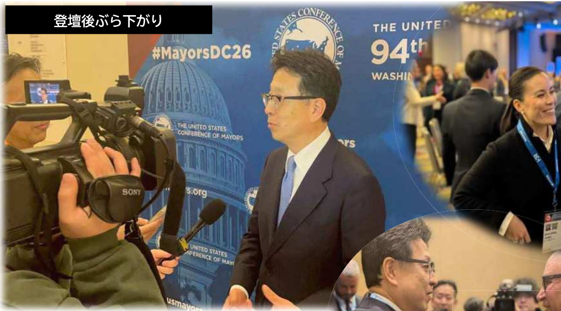
登壇後ぶら下がり