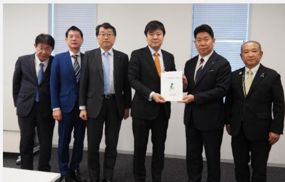
立憲民主党（令和7年12月11日）