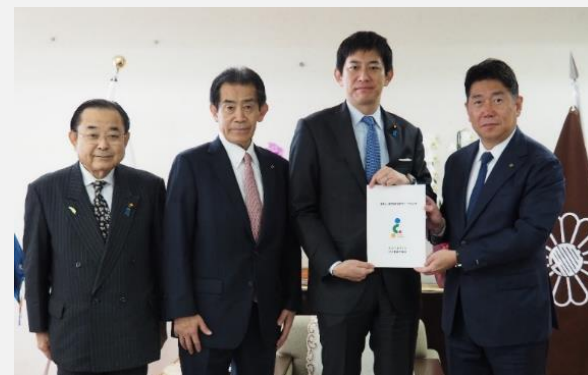
自由民主党（令和7年12月12日）