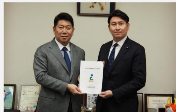
日本維新の会（令和7年12月25日）