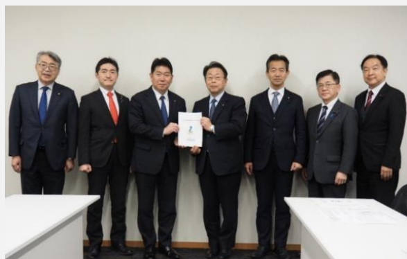
公明党（令和7年12月24日）