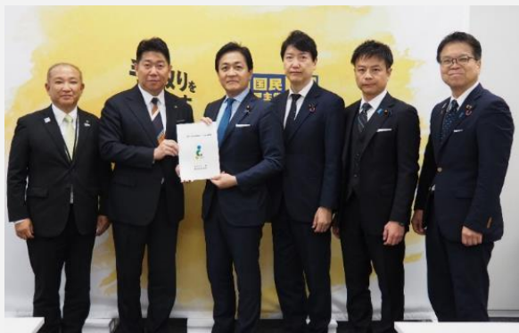
国民民主党（令和7年12月11日）