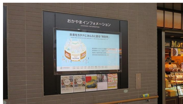
鉄道駅通路におけるデジタルサイネージ （岡山市） （令和7年9月、12月）