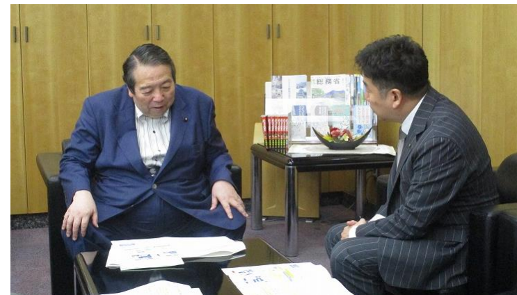
独自要請（総務大臣） （川崎市） （令和7年6月）