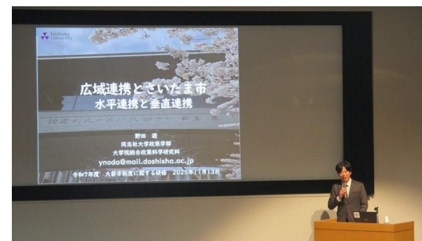
職員研修 （さいたま市） （令和7年11月）