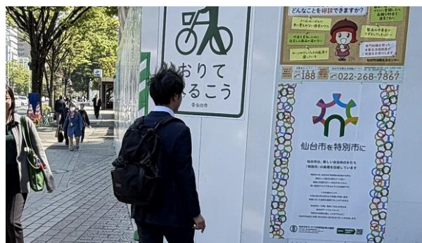
本庁舎解体工事の仮囲いにポスター掲示 （仙台市） （令和7年11月から）