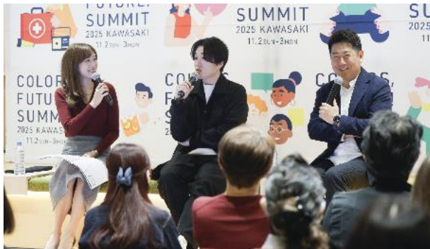
市民向けのトークセッション （川崎市） （令和7年11月）