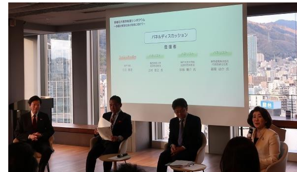
多様な大都市制度シンポジウム （神戸市） （令和8年1月）