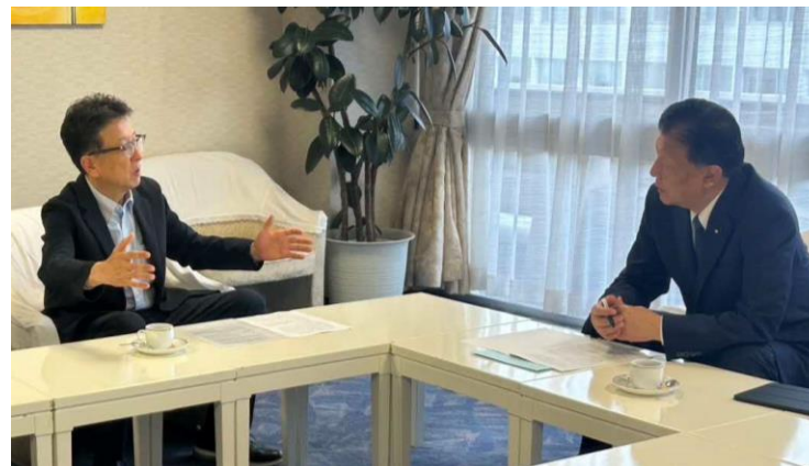
第27回参議院議員通常選挙に向けた 指定都市市長会要請（自由民主党） （熊本市） （令和7年6月）