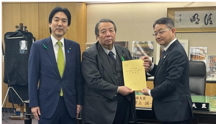
独自要請（総務大臣） （浜松市） （令和7年4月）