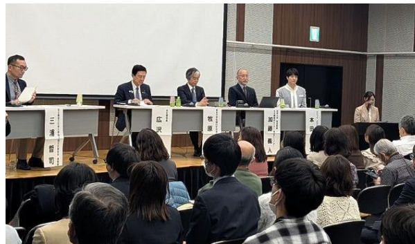
大都市制度講演会 （名古屋市） （令和7年12月）