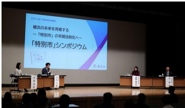
「特別市」シンポジウム （横浜市） （令和7年12月）