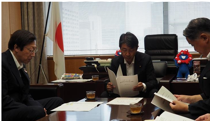
白本を用いた要請活動（総務省） （神戸市） （令和7年8月）