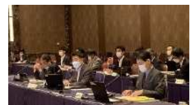
プロジェクト会議の様子