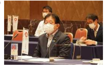
金子総務大臣(当時)との意見交換